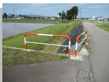
田島地区 安全対策工事