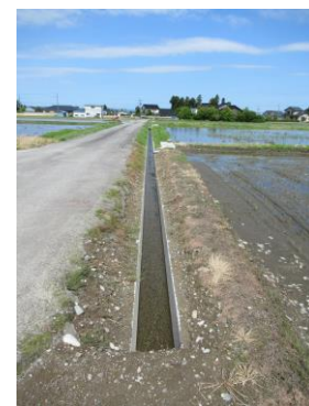
善名地区 水路整備工事